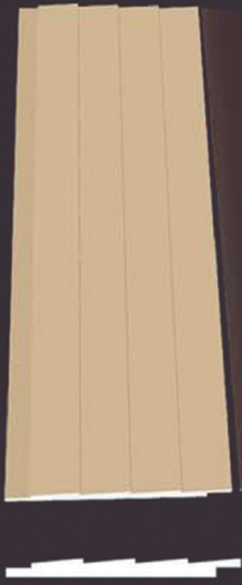
SD 130 50 x 4 x 200 cm