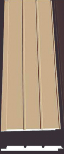
SD 160 50 x 4 x 200 cm