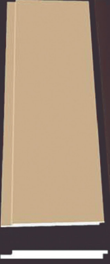
SD 120 50 x 4 x 200 cm