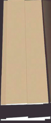
SD 140 50 x 4 x 200 cm