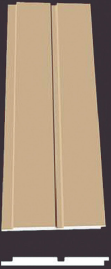
SD 110 50 x 4 x 200 cm