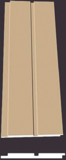
SD 110 50 x 4 x 200 cm