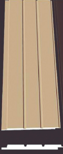
SD 160 50 x 4 x 200 cm

Yapılarınızın en iyi, en güvenilir dostu: Sırf moda diye, dış etkenler dayanıksız ve pahalı kaplamalar, binanızın genel dokusu ile bir bütünlük sağlamıyor ise paranızı sakoğa atmış olursunuz.